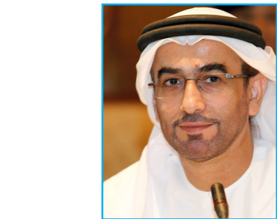
سلطان بن بخيت العميمي

في تونس بجامعة منوبة، ثم رئيساً للأخيرة. من أهم رواياته «الطلباني»، التي حصل من خلالها على العديد من الجوائز.